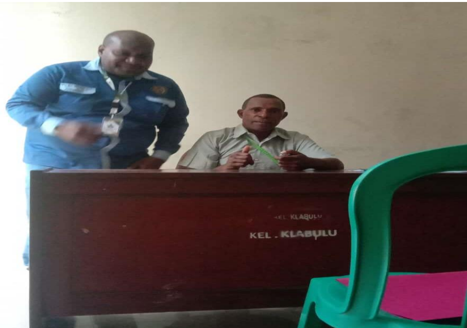
Pemateri sedang bersama dengan Lurah Klabulu