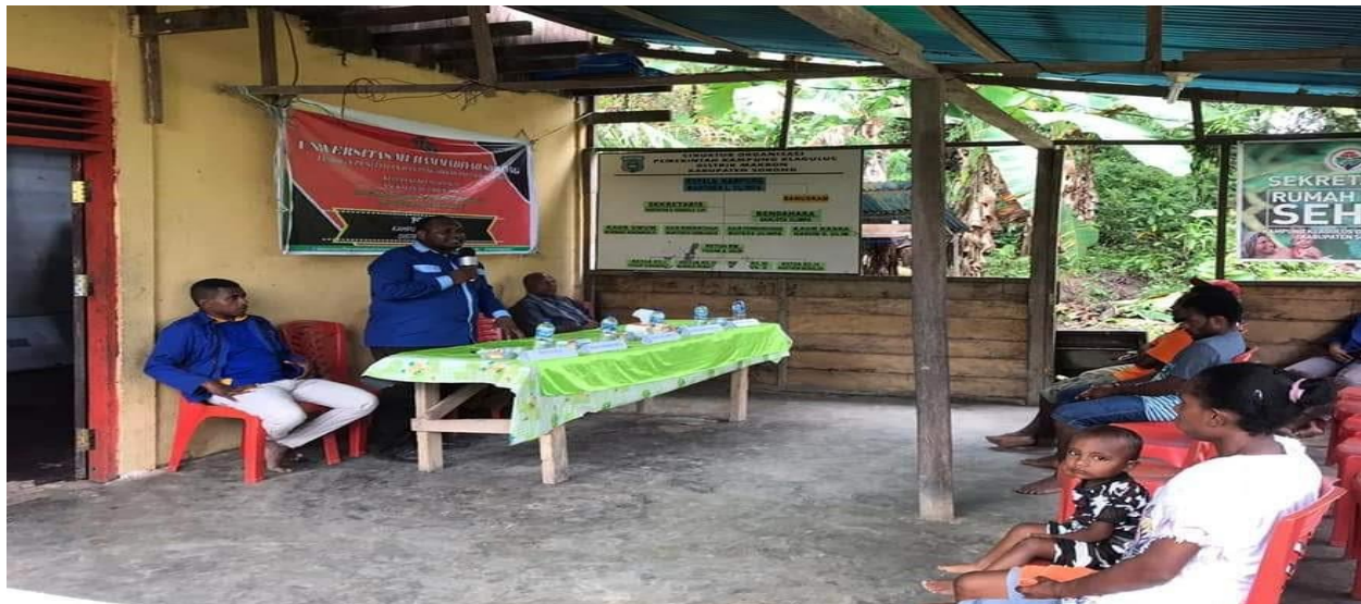
Pemateri sedang membawakan materinya.